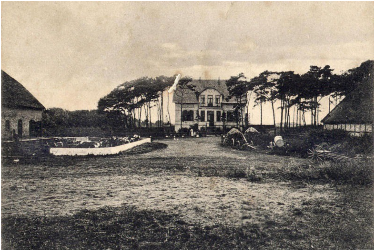
Historische Ansicht Gutshof Neuhaus 1914

So war es einmal vor vielen, vielen Jahren Bild 1 – Gutshaus, Bild 2 Gesindehaus